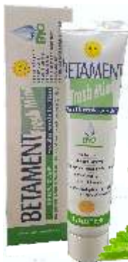
bělící zubní pasta